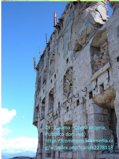
Di L Caumo - Opera propria, Pubblico dominio, https://commons.wikimedia.org/w/index.php?curid=2278118